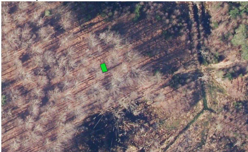
Placering for shelter (markeret med grøn) på satellitfoto fra 2022